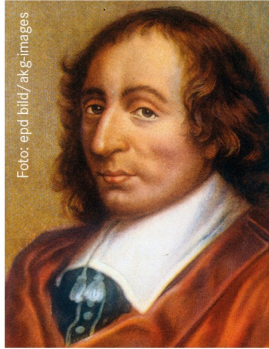
Der französische Philosoph, Mathematiker und Physiker Blaise Pascal (1623–1662; Sammelbild der Gutermann-Nähseidenfabrik um 1920).

Pascal hat den lebendigen Gott erfahren – Gott, der weder durch den Geist der Mathematik noch der Philosophie zu ergründen ist. Im „Mémorial“ heißt es unter anderem: „Jesus Christus. Ich habe mich von ihm getrennt. Ich bin vor ihm geflohen, habe mich losgesagt von ihm,