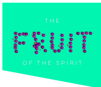
Die Frucht des Heiligen Geistes Galatener 5,22-23